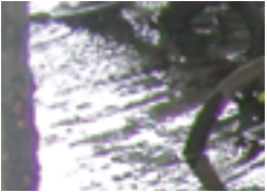
しっかりと根を張るマングロープ