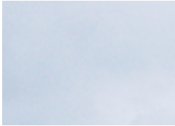
由布島への往復は水牛車でんびり