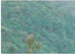
浦内川上流にあるマリウドウの滝

④マングロープ 仲間川は浦内川に次ぐ大きな川で、広い川の両岸にはマングロープが茂る。遊覧ボートに乗って、まさにアマゾンのような景観が楽しめる。