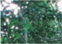
巨大な根が張り出すサキシマスオウ