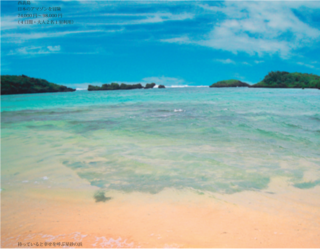
西表島 日本のアマゾンに冒険 74,000円～98,000円 (4日間・大人2名1室利用)